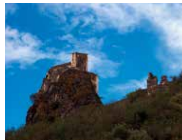
Aubignas Le village